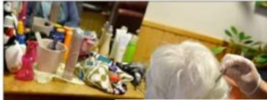
Lemland och Mariehamn deltar i ett...