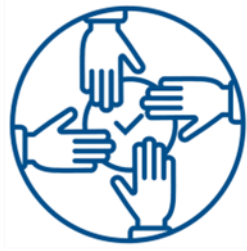
TRUST BETWEEN ACTORS