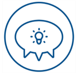
COMMUNICATION AND KNOWLEDGE SHARING