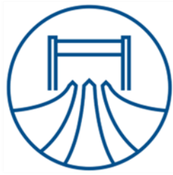
COMMON OR SHARED GOALS